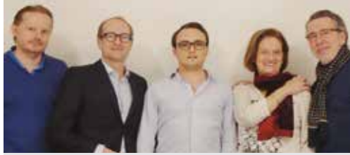
De Ring van de toekomst (p. 2)